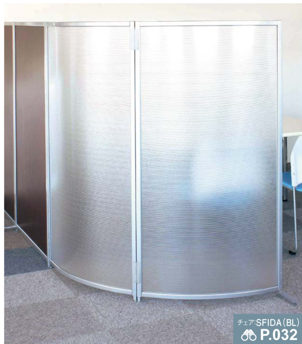
写真はSMP-R1808PC(CR)、SMP-1809MP(WT)、安定脚:SMP-F、連結金具:SMP-SJ