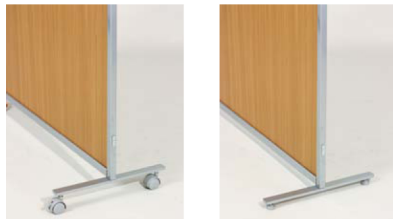
SMP-FK JAN 054581 SMP 安定脚 (キャスター脚)