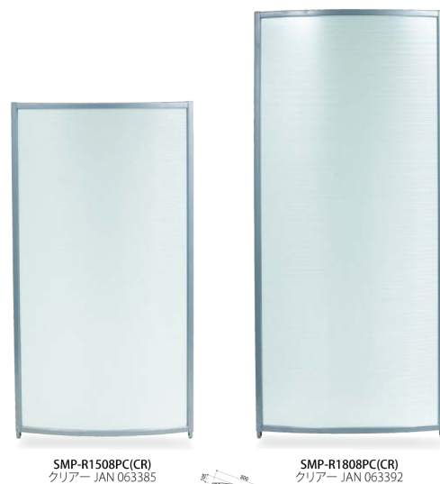
SMP-R1508PC(CR) クリア JAN 063385